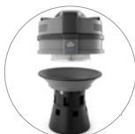
Ultra FilteRing System