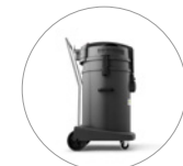
Wagen und ergonomischer Griff