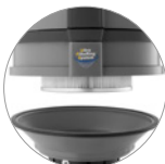
PTFE Kartuschenfilter (KLASSE M)