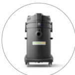
35% recycelter Kunststoff