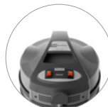
Einschalter (zwei motoren)