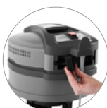
Filtro aire de escape