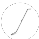
Tubo de succión telescópico "S"