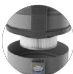
Filtro de cartucho en PTFE (clase M de filtración)