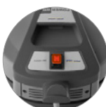
Tarjeta de conmutación