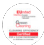
Certificazione EU United