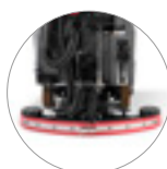
Tergitore regolabile e compatto