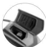
Debris tray + filtro