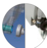
Filtro a immersione