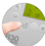
Funzione modalità silenziosa