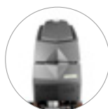
23% di plastica riciclata