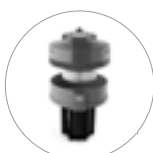
Ultra FilteRing System