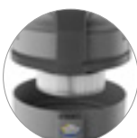
Filtro cartuccia in PTFE (classe M) sempre installato