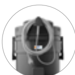
Dispositivi di sostegno accessori