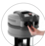
Prese ingresso e uscita aria raffreddamento motore