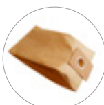
Sacchetto carta (optional)