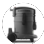
24% di plastica riciclata