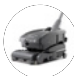
17% di plastica riciclata