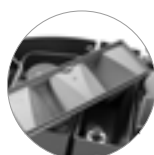
Serbatoio soluzione a tenuta con funzione di dosaggio detergente