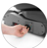
Batterie al litio