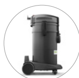
25% de plastique recyclé