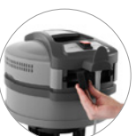
Filtre air à la sortie