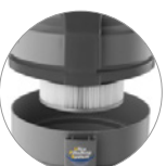
Filtre à cartouche en PTFE (classe de filtration M)