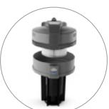
Ultra FilteRing System