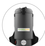
16% de plastique recyclé