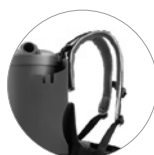
Harnais anatomique porte accessoires très pratique