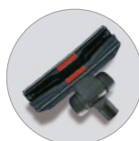
Embout sol avec roues RD 285