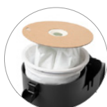
Sac filtre fleece et filtre textile