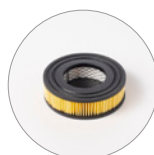
Filtre à cartouche (HEPA en option)